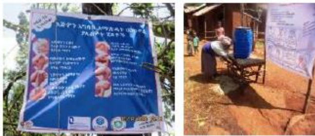
Affiche et station de démonstration de lavage des mains en Ethiopie

Il n'y a plus en Ethiopie de restrictions spécifiques liées à la pandémie. Le pays est en revanche plus préoccupé par les tensions et affrontements interethniques et le conflit dans la région rebelle du Tigré. Tensions qui épargnent globalement la région SNPPR, dans le sud du pays, où nous intervenons.