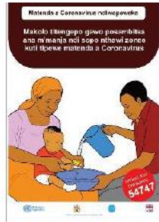
Affiche utilisée par les animateurs pour les visites à domicile au Malawi

A noter cependant que les équipes du programme EHA, dans le cadre normal de leurs activités, ont préféré continuer une sensibilisation des familles au porte-à-porte considérant que c'est un bon moyen de toucher l'ensemble des membres du ménage. En effet durant les animations en groupes (PHAST), il n'y a souvent qu'un membre de la famille présent et la diffusion n'est pas toujours garantie. En revanche, si les séances à domicile sont plus courtes, la participation est de fait plus active et notamment les enfants sont souvent moteurs et volontaires pour commenter les images et supports de communication qui leurs sont présentés.