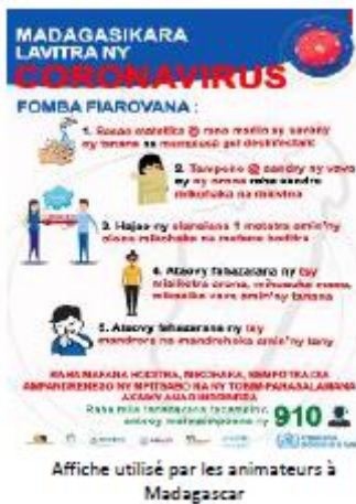
Affiche utilisée par les animateurs à Madagascar

Là encore, si parmi les régions où nous intervenons, les régions Anlamanga et Analanjirifo ont été parmi les plus touchées, la situation est revenue à la normale aujourd'hui et les cas ont drastiquement diminués. Les vols ont cependant longtemps été suspendus.