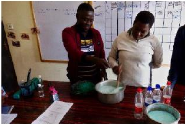
Appui aux centres de santé de Phalombe (Malawi) pour la production de gel hydroalcoolique