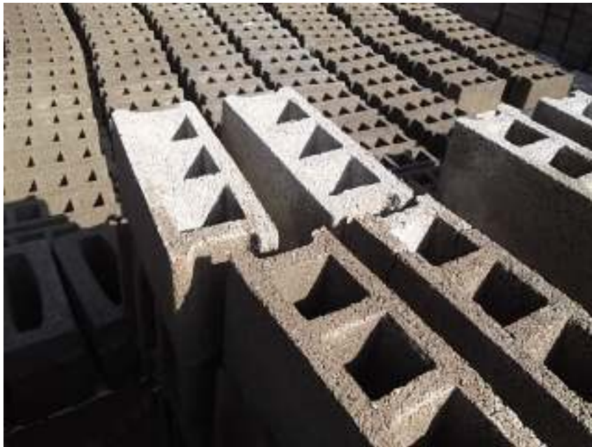
Arrosage des blocs pendant séchage