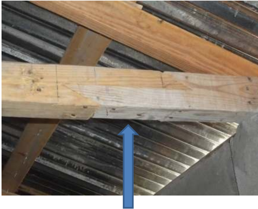
Continuité des bois